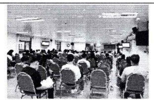
ภาพประกอบกิจกรรมที่ ๑