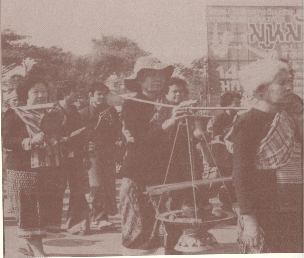
ขบวนแห่ทางวัฒนธรรมของกลุ่มชาติพันธุ์ย้อ ตำบลธาตุเชิงชุม อำเภอมือง ในงานนิทรรศการทางศิลปวัฒนธรรม “มูนมั่งอีसान” ระหว่างวันที่ ๑๔ - ๑๖ มกราคม ๒๕๖๒ ณ วิทยาลัยครู

โครงการนิทรรศการทางศิลปวัฒนธรรมมูนมั่งอีसान ในระยะแรกมีข การจัดงานประกอบด้วย การจัดแสดงนิทรรศการภูมิปัญญาพื้นบ้าน การจัดการป และการแสดงทางศิลปวัฒนธรรม โดยมีการจัดงานอย่างต่อเนื่อง ครั้นต่อมามหาวิ ราชภัฏสกลนคร โดยสถาบันภาษา ศิลปะและวัฒนธรรม ร่วมกับจังหวัดส องค์การบริหารส่วนจังหวัดสกลนคร เทศบาลนครสกลนคร การท่องเที่ยวแ จังหวัดสกลนคร และสภาวัฒนธรรมจังหวัดสกลนคร ยกกระตือรือร้นการจัดงาน “งานมหกรรมภูมิปัญญาพื้นบ้านมูนมั่งอีसान”