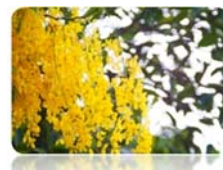
ต้นราชพฤกษ์ (ต้นคูณ)