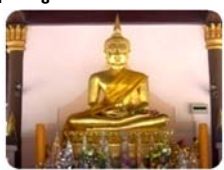
พระพุทธรูปรัชปัญญาบารมี