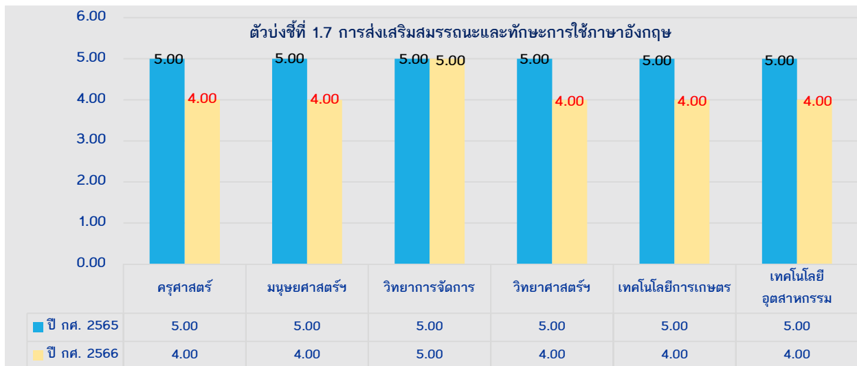
กราฟแสดงการเทียบเคียงตัวบ่งชี้ที่มีแนวโน้มลดลงจากปีการศึกษา 2565

หมายเหตุ : ข้อมูลคะแนนประเมินย้อนหลัง จากภาคผนวก สรุปคะแนนผลการประเมินคุณภาพการศึกษาภายใน ระดับคณะ ย้อนหลัง 7 ปี (ปีการศึกษา 2560 – 2566) (หน้า 51)