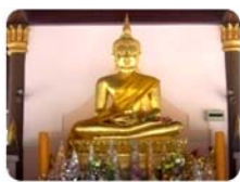
พระพุทธรูปปัญญาบารมี