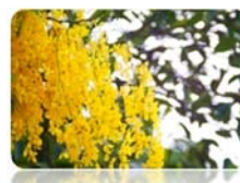
ต้นราชพฤกษ์ (ต้นคูณ)